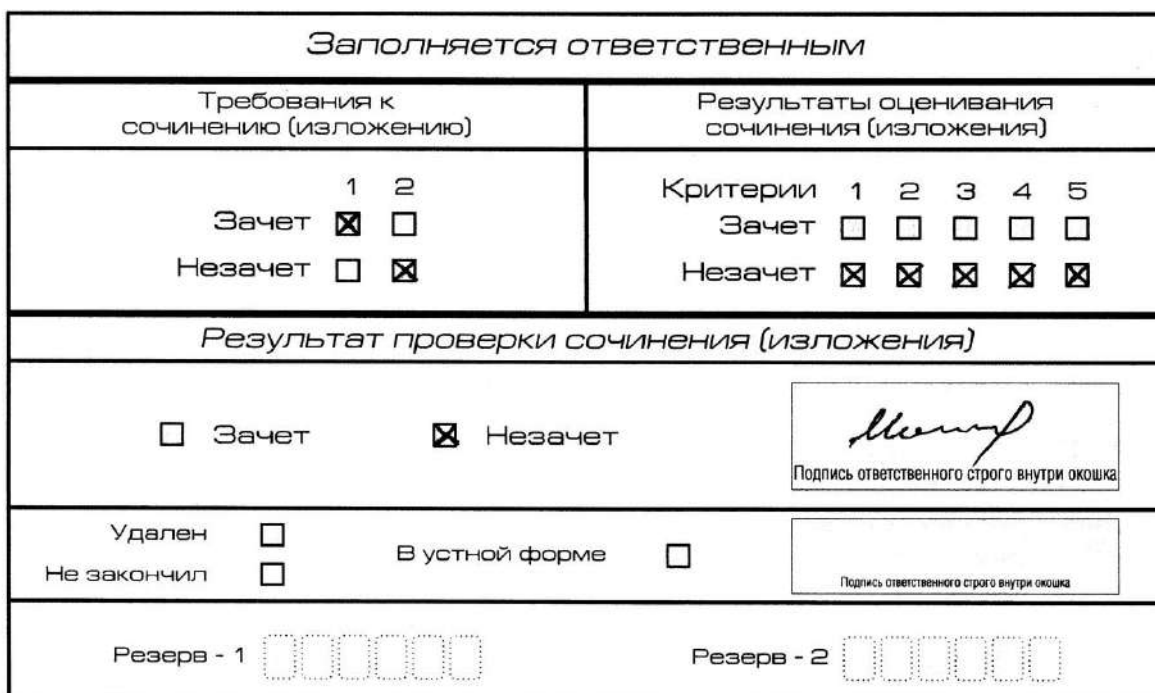
Рис. 9. Область для оценки работы

Если итоговое сочинение (изложение) соответствует требованию № 1 и требованию № 2, то выставляется «зачет» за выполнение требования № 1 и требования № 2. Указанные сочинения (изложения) далее оцениваются по критериям.