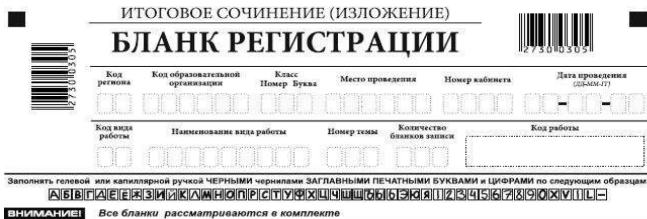
Рис. 2. Верхняя часть бланка регистрации

Бланк регистрации (рис. 1) состоит из трех частей: верхней, средней и нижней.