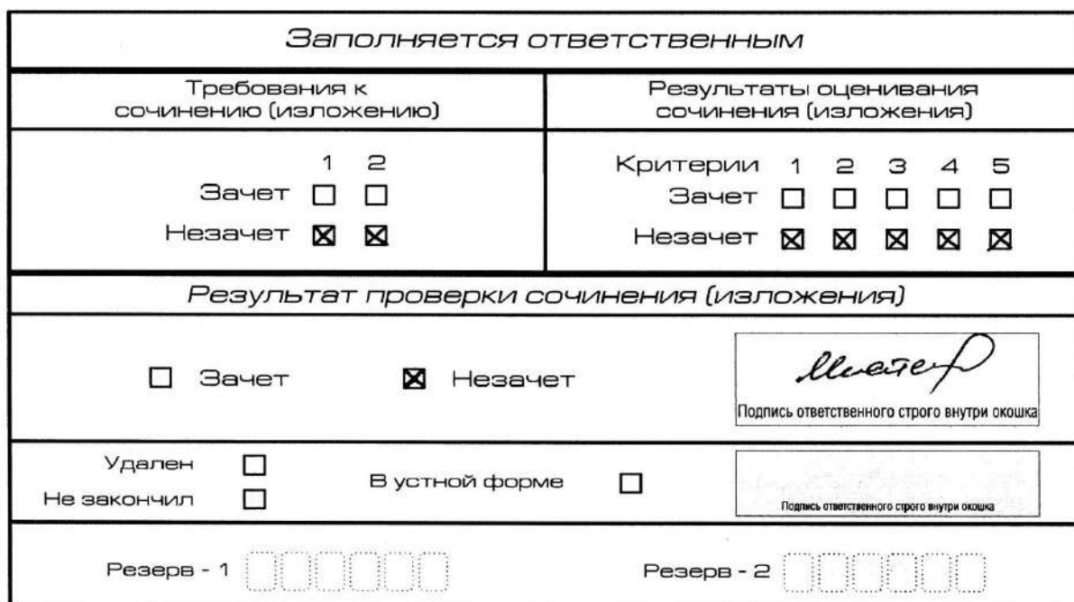
Рис. 8. Область для оценки работы